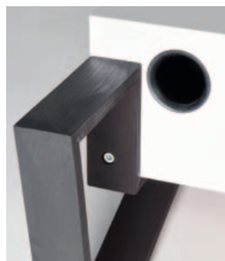
Downfire Bassreflex: Das Finish der Beine ist hier noch Vorserie.

Beide Lautsprecher sind komplett identisch. Einer wird mit Musiksignalen beliefert und